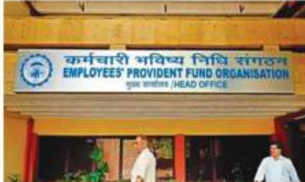
बैठक में अधिक पेंशन की खातिर आवेदन देने के लिए सुप्रीम कोर्ट ने चार महीने का वकत देने संबंधी

निर्णय आज से शुरू हो रही दो दिन की बैठक में ले सकता है। इसमें अल्लुवा सीबीटी की जो आदेश दिया था, उस पर ईपीएफओ ने क्या कार्रवाई की है। इस बारे में भी बैठक में चर्चा हो सकती है। दरअसल ईपीएफओ ने अपने अंशधारकों को तीन मई, 2023 तक का समय दिया है।